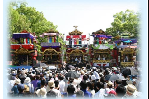
知立神社に勢揃いした5台の山車

祭り当日は、五台の山車が町内を練り歩き、知立神社に勢ぞろいします。そして、文楽・からくりによる人形浄瑠璃芝居が上演されます。