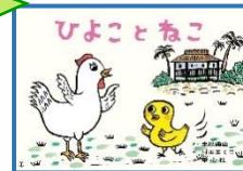
重松 彌佐 脚本 村田 エミコ 絵 出版社:童心社