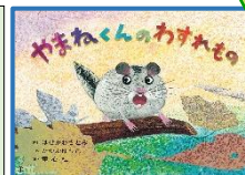
はせがわ さとみ 脚本 たかお ゆうこ 絵 出版社:童心社