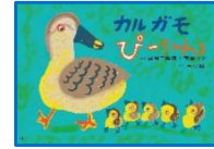
宮崎二美枝/脚本 市居みか/絵 出版社:童心社