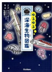
ゆるゆる深海生物図鑑:本編 そにしけんじ / 石垣幸二(監修) Gakken