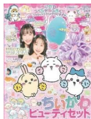
キラピチ KIRAPICHI 雑誌 Gakken