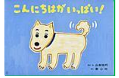
山本 祐司 脚本・絵 出版社：童心社