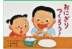
よこみち けいこ 脚本 北村 裕花 絵 出版社：童心社